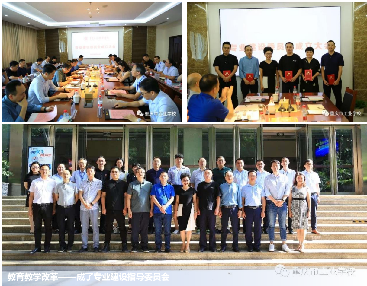
教育教学改革——成了专业建设指导委员会

适应行业企业需求，在此基础上，结合教育部《指导意见》的要求，修订和完善 25 个专业人才培养方案，提交校党委会议审定通过，并将于年底通过学校网站主动向社会公开，接受全社会监督。通过一系列规范的修订工作，我校人才培养方案更加规范完善，为教学实施提供了可靠的保障。具体情况见表 25。