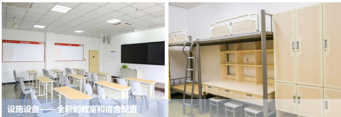
设施设备——全新的教室和宿舍配置

一教学楼和世纪楼的装饰改造，同时，为全校学生宿舍卫生间新购置了 438 套钛铝合金门，增添了空调、课桌椅等设施设备，改善了学生住宿的条件与教师教书育人的环境，为学校教书育人工作提供了更好的基础设施保障。