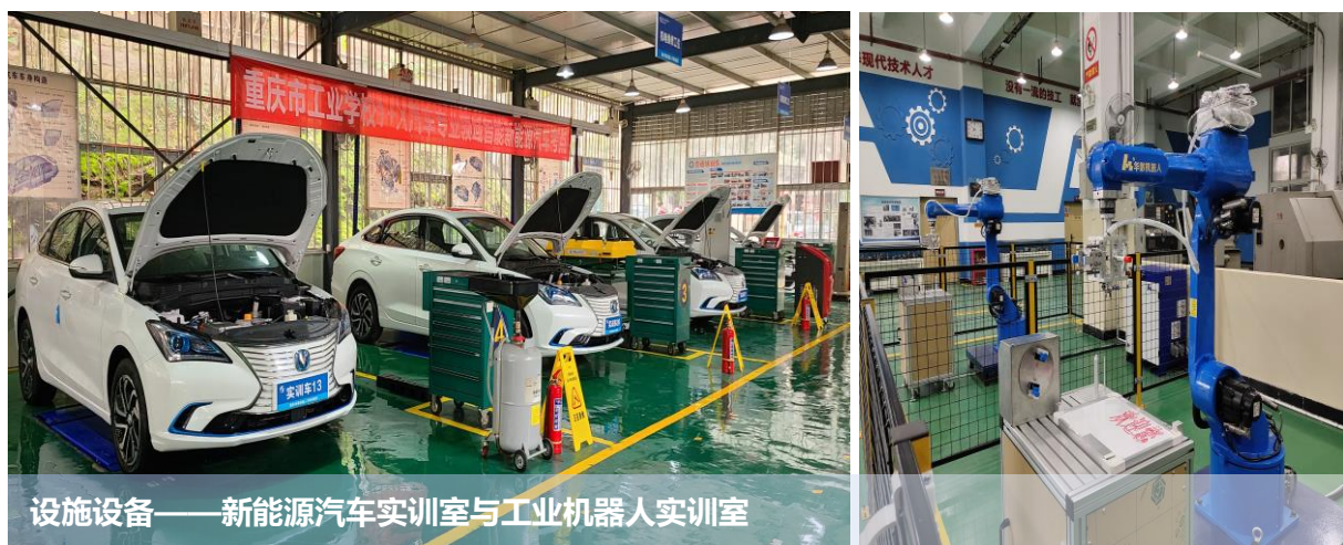
设施设备——新能源汽车实训室与工业机器人实训室

本学年，学校大数据技术与应用专业立项重庆市中等职业教育实训基地建设项目——高水平专业化产教融合实训基地，机电技术应用专业立项重庆市中等职业教育现代学徒制试点项目，学校立项重庆市优质中职学校和优质专业建设项目 A 类建设单位，共获得市财政专项建设资金 725 万元。同时学校稳步推进校企合作示范项目、环境监测与治理技术公共实训基地等 7 个市级重点建设项目，累计投入 911.7 万元，新建大数据实训室、1+X 光伏电站运维实训室、工业机器人实训室、新能源汽车实训室、物流综合实训室等 8 个实训室，改建数字创意实训中心与环境监测实训中心，新增工位 117 个，各专业的实习实训条件大大改善。截至 2021 年 8 月 31 日，学校教学设备总值为 5058.66 万元，本学年新增教学、实训仪器设备 911.7 万元，在校生生均设备值达 7879.53 元，校内实践工位 4101 个，能较好地满足专业实训教学需要，有效地提升了实训教学质量。各专业大类实训基地建设具体情况如表 11 所示。