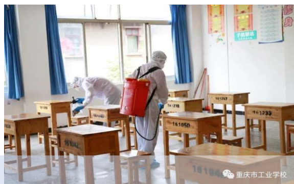
安全管理——进行安全检查和防疫演练